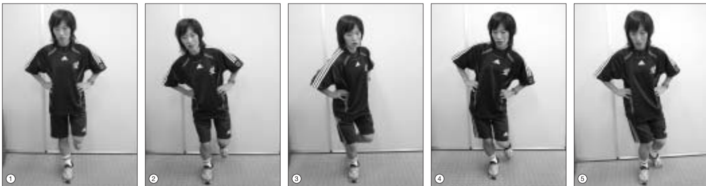
①片脚立ち。②体幹が傾いたり、③回旋したり、④上げているほうの骨盤が下がったり、⑤膝が内側に入ったりしていないかをみる

前述の片脚立ちや片脚スクワットのほかに、中殿筋、腹斜筋、腹横筋の収縮に左右差が認められることがあるので、MMT（徒手筋力テスト）ではないのですが、徒