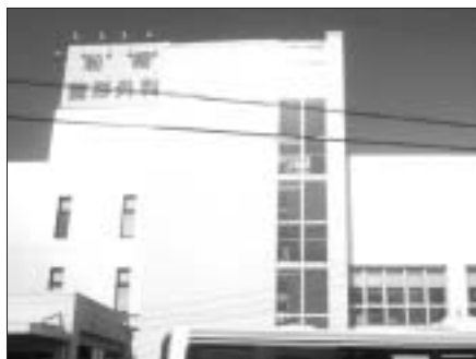
船橋整形外科病院

アスリートの場合は、長距離選手に多くみられますが、跳躍系の選手などでもみられます。またサッカーやラグビーなど硬いスパイクを履くような競技でも、直接病院に来るケースは少ないですが現場ではかなりある印象です。一般の方でも長時間の立