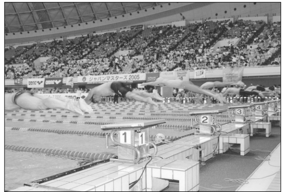
写真1 ジャパンマスターズ風景

方を対象とした水泳競技会の現状は、2006年に国内で行われた日本マスターズ水泳協会が公認している競技会の数は、協会が主催した競技会が4大会24会場、そして、協会が公認した競技会が59会場、合計83の会場で行われています(写真1)。